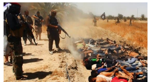
גלים של אימה:

אנשי "ארגון המדינה האסלאמית" טובחים בשבויים