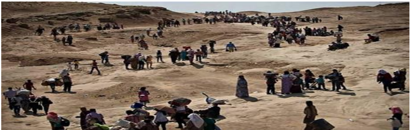
נעים במעגלים : פליטים יזידים בהרי סינג'אר