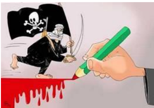
נתיב הדמים של "ארגון המדינה האסלאמית" – קריקטורה בעיתון סעודי